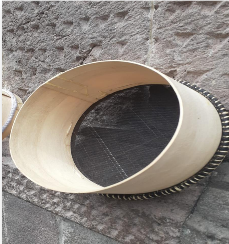
Cedazos de crin de caballo

Contacto: Guido Paucar Correo: luigupaca@hotmail.com Teléfono: 0995653318