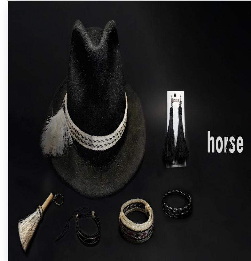
Pulseras, sombreros con bordados de crin de caballo

Contacto: Roberto Cachiguango Correo: croberto666@hotmail.com Teléfono: 0999835002