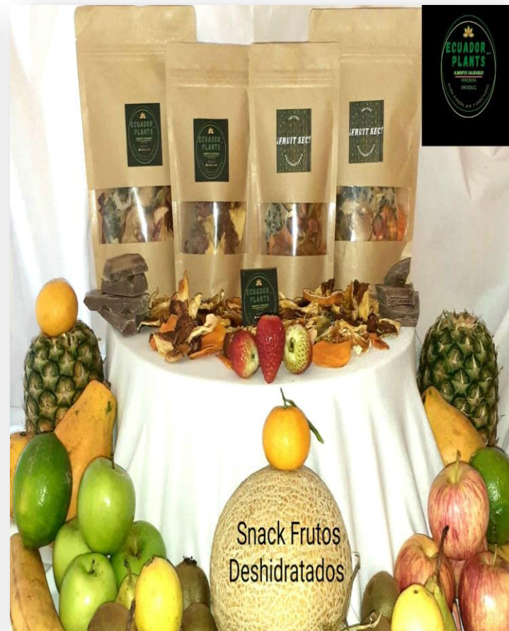
Frutos deshidratados, conservas en aceite de oliva.