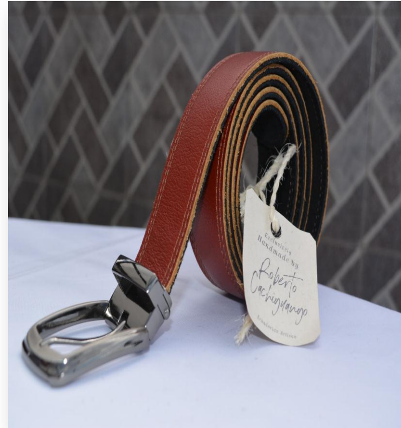
Artículos de cuero hechos a mano

Contacto: Guido Paucar Correo: luigupaca@hotmail.com Teléfono: 0995653318