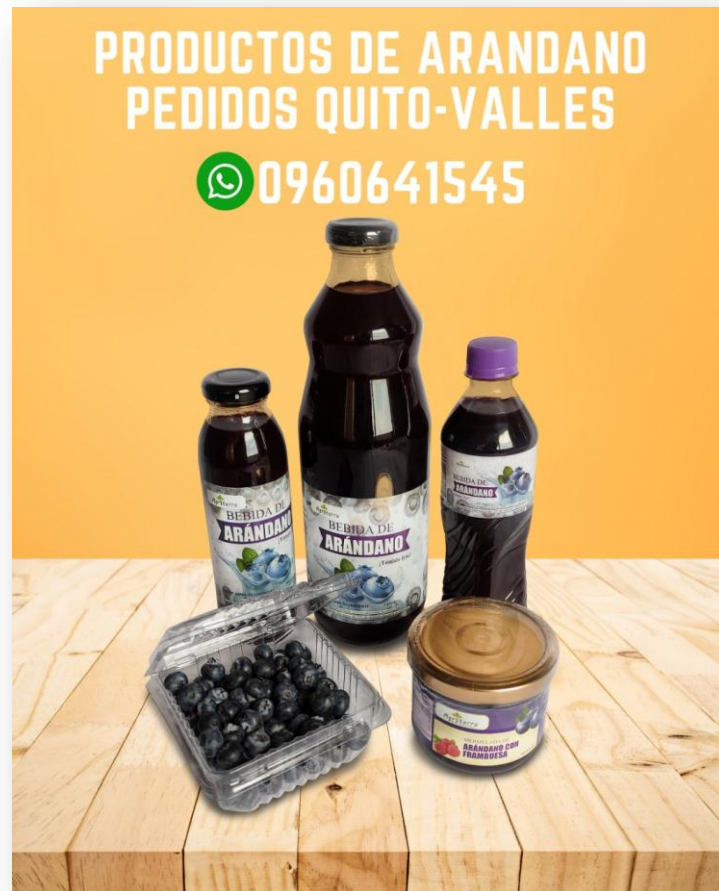
Jugo y mermelada de arándanos