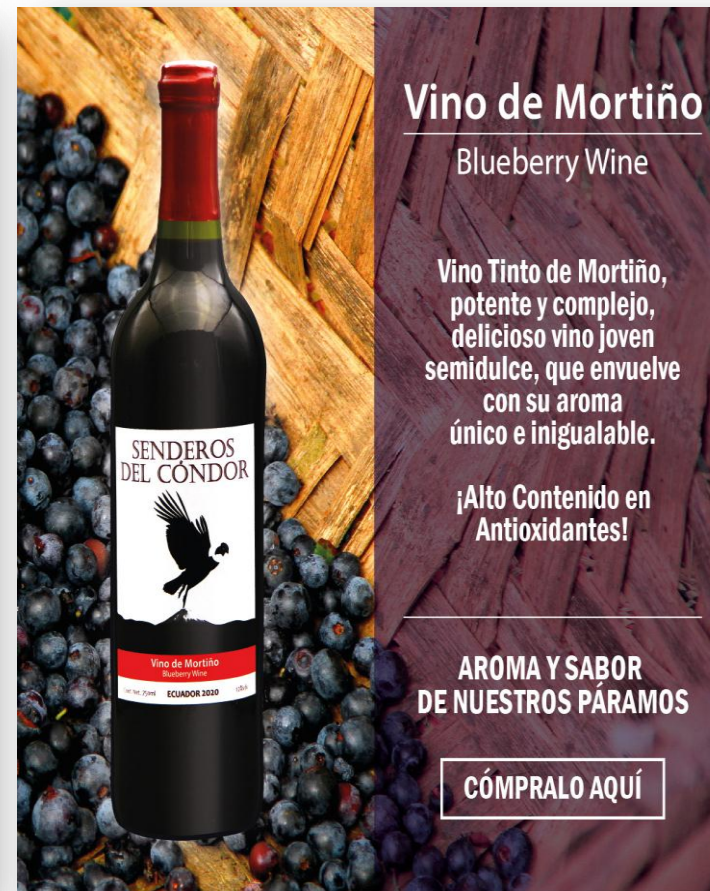
Vino de mora y mortiño

Contacto: Olga de la Nube Pineda Correo: nube.pineda@gmail.com Teléfono: 0987855672