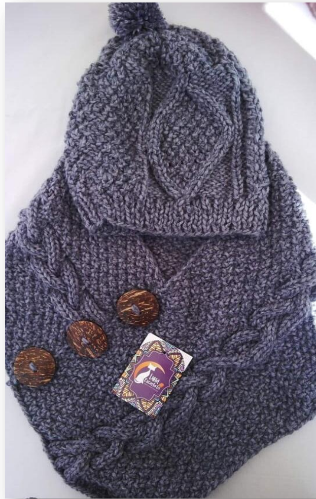
Cueller y gorra para caballero

Contacto: Olga Lovato Correo: artesguapulo@gmail.com Teléfono: 0987127146