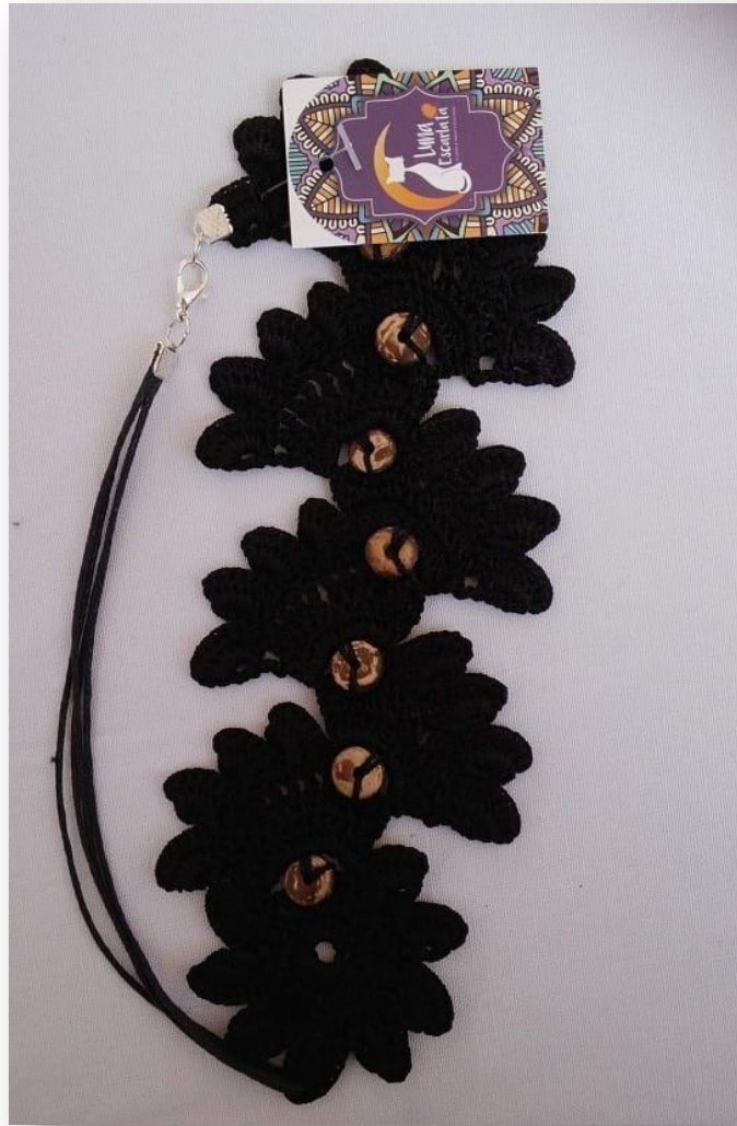
Collar Despojando Margaritas

Collar negro tejido a mano con hilo perle con botones de coco.