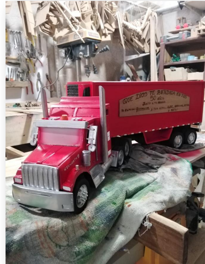
MANOS LIBRES ARTE EN MADERA