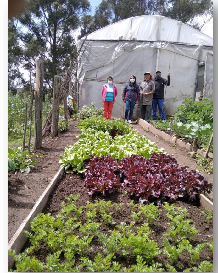
HUERTOS HERMANITOS DE TURUBAMBA