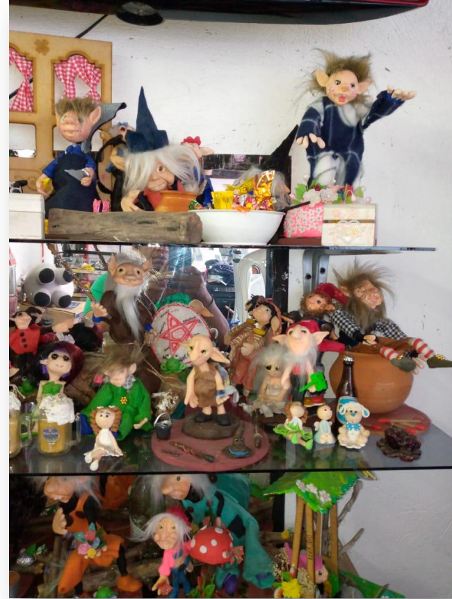
MI CASITA DE LOS DUENDES