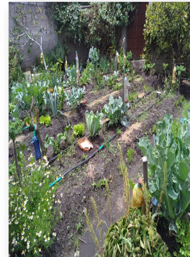
Col, lechuga y hierbas aromáticas

Contacto: Blanca Pillajo Correo: blancapillajo62@gmail.com Teléfono: 0989461214