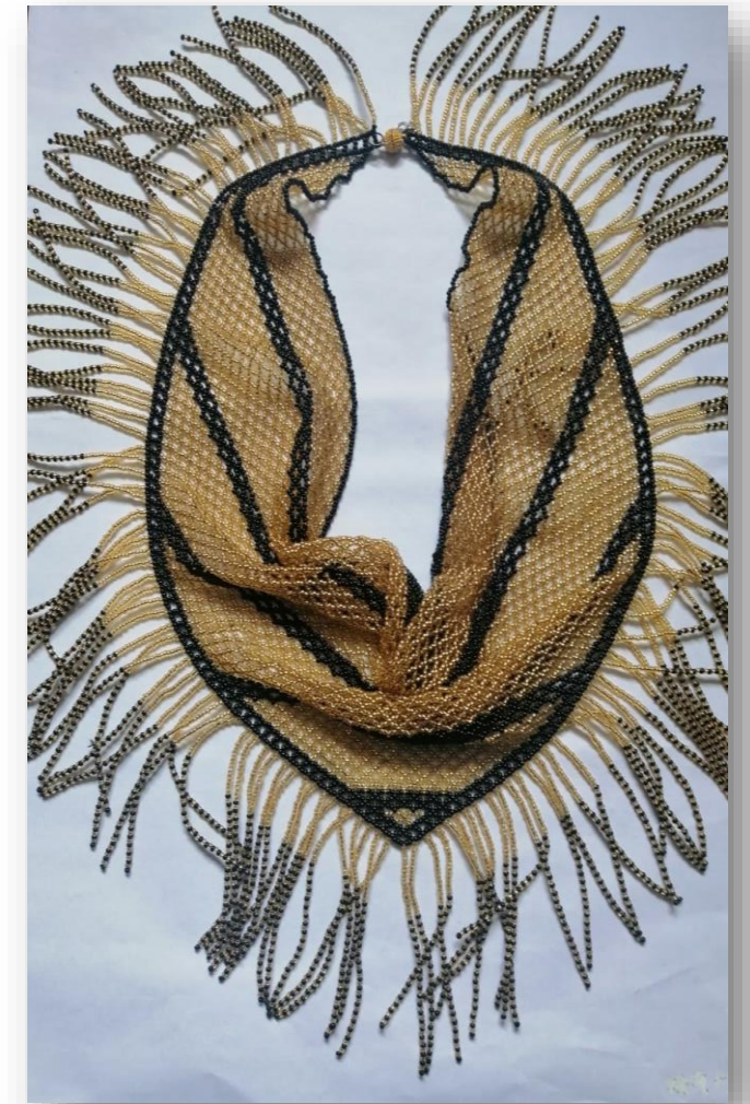
Bufanda en mostacilla checa