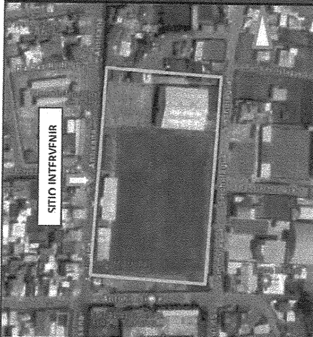
IMAGEN DEL AREA O VIA A INTERVENIR