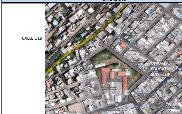
IMAGEN DEL ÁREA O VÍA A INTERVENIR