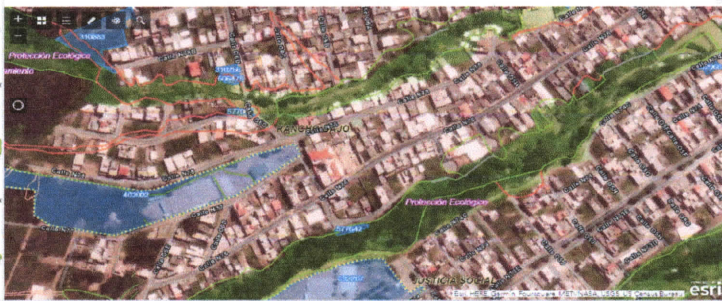
IMAGEN DEL ÁREA O VÍA A INTERVENIR