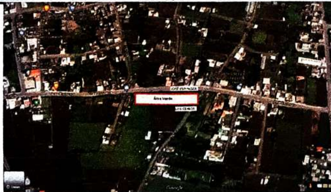
IMAGEN DEL ÁREA O VÍA A INTERVENIR